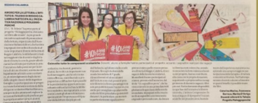
Noi Magazine, 14 novembre 2019