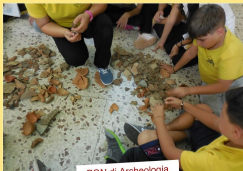
PON di Archeologia