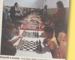
Scacchi a scuola. Una fase delle competizioni