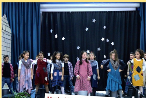
Musical "La piccola Annie"