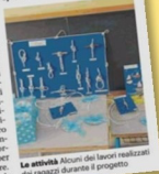
Gazzetta del Sud, 6 ottobre 2019