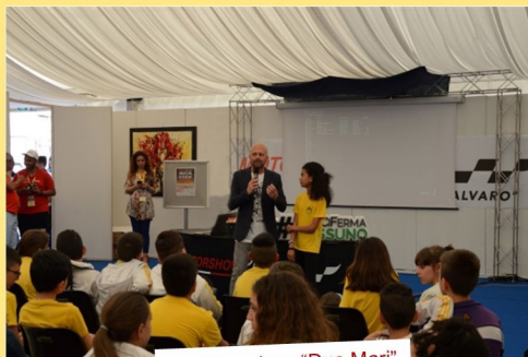
Al Motor show "Due Mari"

Visita virtualmente la nostra scuola per conoscere il PIANO TRIENNALE DELL'OFFERTA FORMATIVA